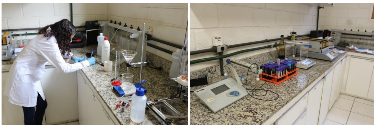
Figura 2: Laboratório do Escalab.